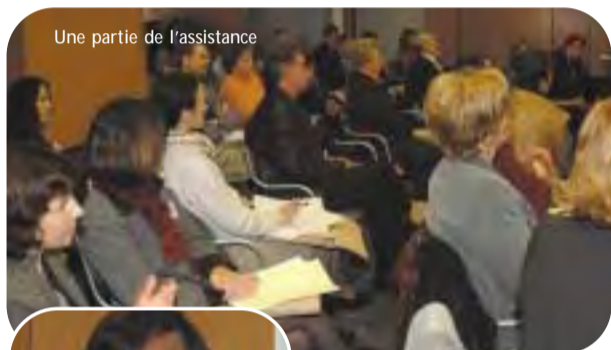
Une partie de l'assistance

dans l'entreprise, une augmentation des ventes par l'amélioration de l'accueil et de la présentation... Mais la formation, c'est aussi, pour le salarié en poste depuis longtemps dans l'entreprise artisanale, une projection dans l'avenir d'une certaine efficacité d'un salarié dans une future activité et un argument de promotion sociale... La régularité de la formation, c'est la garantie de bonne santé de l'entreprise. Tout ceci n'est pas un vœu pieux... J'engage dans ces paroles non seulement ma fonction de Président de Multifaf, mais aussi mon statut de chef d'entreprise artisanale. À aucun moment, je ne perds de vue que la formation est un investissement pour l'employeur qui doit trouver sa place dans le bilan chiffré. Mais ce n'est pas parce qu'on fait référence à l'aspect financier que c'est uniquement une charge pour l'entreprise. Multifaf est là pour vous aider à organiser votre plan de formation, pour vous accompagner dans la formation de vos salariés et pour prendre en charge à la fois les frais pédagogiques et les frais annexes (les déplacements, les repas,...) dans certains cas. Ayez toujours en tête que la formation professionnelle continue, c'est une garantie de qualité et de bonne image de votre entreprise. Formons ensemble les salariés de l'artisanat de demain."