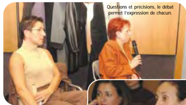
Questions et précisions, le débat permet l'expression de chacun.

Dans ces opérations, le rôle de Multifaf est celui d'un organisme relais, c'est-à-dire qu'il redistribue des fonds en provenance du Fonds Social Européen en direction des entreprises. Catalyseurs de projets collectifs de formation (l'OPCA porte le projet de plusieurs partenaires) ou de projets individuels, concernant une entreprise particulière, Multifaf aide à préparer et à mettre en œuvre des actions proposées individuellement par des entreprises et développer des projets collectifs. Multifaf utilise son expertise pour faciliter le montage et le suivi des projets au profit des entreprises (ingénierie pédagogique et financière, accompagnement et suivi du plan de formation, contrôle des dépenses, réalisation des bilans notamment), il informe et sensibilise les entreprises sur la capacité d'intervention du Fonds Social Européen."