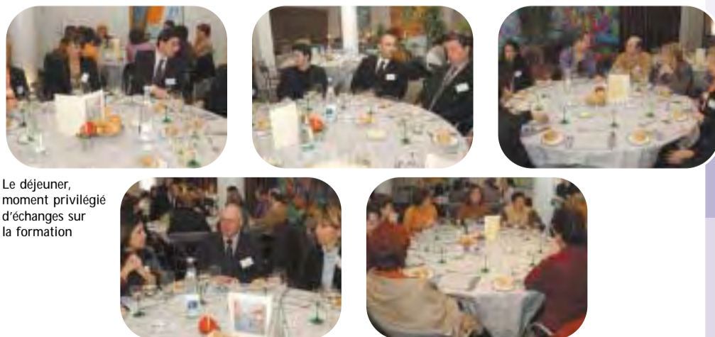
Le déjeuner, moment privilégié d'échanges sur la formation

Les échanges et débats qui suivirent mirent en lumière l'intérêt de tous les participants pour ce qui avait été dit. Des chefs d'entreprises, des représentants d'organisations de salariés et des représentants de l'État s'exprimèrent à ce moment. Lors du repas pris en commun, les échanges se firent encore plus personnels et permirent d'éclaircir certains points du fonctionnement de Multifaf qui avaient pu rester obscurs.