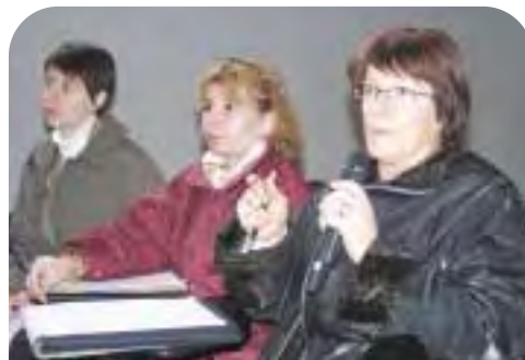
Les représentantes de la Coiffure en Côte-d'Or

Il y a deux ans que Multifaf a entrepris un tour de France des capitales régionales pour aller à la rencontre des artisans des métiers et des services, cette journée à Dijon faisait partie du programme destiné à encourager le développement de la formation professionnelle. Les rencontres continuent en 2004 dans d'autres régions.