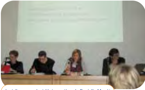
La tribune pendant l'intervention de Danielle Messié