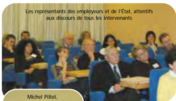
Les représentants des employeurs et de l'État, attentifs aux discours de tous les intervenants

Tout ceci n'est pas un vœu pieux... J'engage dans ces paroles non seulement ma fonction de Président de Multifaf, mais aussi mon statut de chef d'entreprise artisanale. À aucun moment, je ne perds de vue que la formation est un investissement pour l'employeur qui doit trouver sa place dans le bilan chiffré. Mais ce n'est pas parce qu'on fait référence à l'aspect financier que c'est uniquement une charge pour l'entreprise. Multifaf est là pour vous aider à organiser votre plan de formation, pour vous accompagner dans la formation de vos salariés et pour prendre en charge à la fois les frais pédagogiques et les frais annexes (les déplacements, les repas,...) dans certains cas. Ayez toujours en tête que la formation professionnelle continue, c'est une garantie de qualité et de bonne image de votre entreprise. Formons ensemble les salariés de l'artisanat de demain."