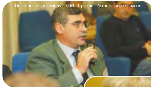
Questions et précisions, le débat permet l'expression de chacun

Dans ces opérations, le rôle de Multifaf est celui d'un organisme relais, c'est-à-dire qu'il redistribue des fonds en provenance du Fonds Social Européen en direction des entreprises. Catalyseurs de projets collectifs de formation (l'OPCA porte le projet de plusieurs partenaires) ou de projets individuels, concernant une entreprise particulière, Multifaf aide à préparer et à mettre en œuvre des actions proposées individuellement par des entreprises et développer des projets collectifs. Multifaf utilise son expertise pour faciliter le montage et le suivi des projets au profit des entreprises (ingénierie pédagogique et financière, accompagnement et suivi du plan de formation, contrôle des dépenses, réalisation des bilans notamment), il informe et sensibilise les entreprises sur la capacité d'intervention du Fonds Social Européen."