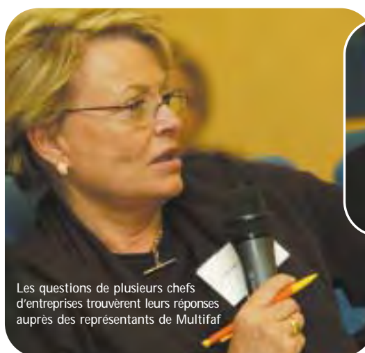
Les questions de plusieurs chefs d'entreprises trouvèrent leurs réponses auprès des représentants de Multifaf