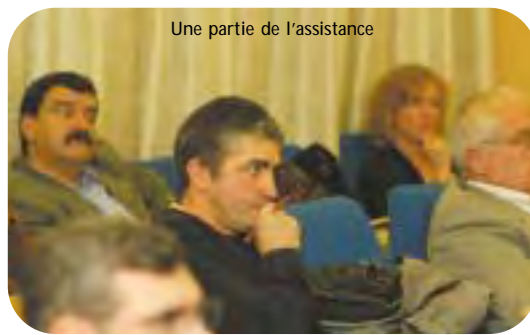
Une partie de l'assistance

En ce qui concerne les jeunes en insertion professionnelle, le Contrat de Qualification est le plus pratiqué, beaucoup plus que les Contrats d'Orientation et d'Adaptation. Véritable chance de professionnalisation, au même titre que l'Apprentissage, rattaché au système de formation initiale, ce contrat équilibre les temps de travail en entreprise et les périodes en centre de formation, permettant d'acquérir les théories en même temps que les pratiques professionnelles. La réussite de ce contrat auprès de l'artisanat et le taux très favorable d'embauches définitives à son issue en font une valeur sûre.